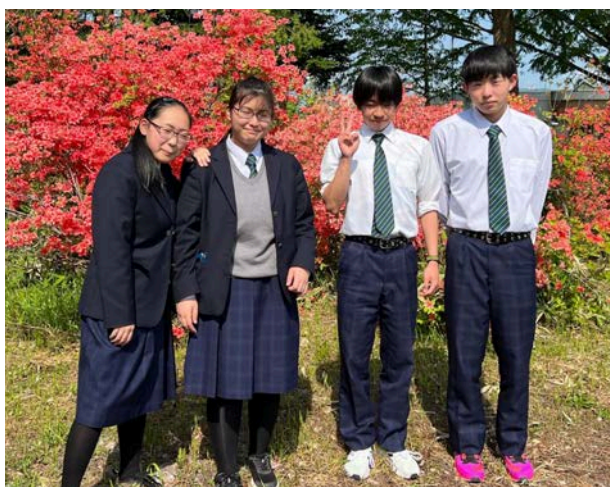
「農校な甘うま味噌かつ丼」開発メンバー