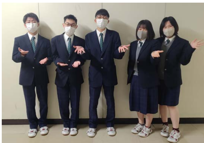
「え！？これが噂のベーコン丼！」開発メンバー

※発売日の3月28日には静内農業高校食品科学科の2年生がしずない店で店頭に立って販売を行います。