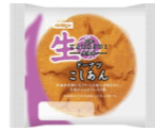
Thetakasui ドーナツこしあん