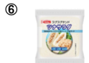
⑥ ラブラブサンド ツナサラダ