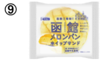
⑨ 函館メロンパン ホイップサンド