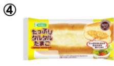
④ たっぷりタルタル たまご