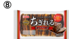
⑧ ちぎれる チョコブレッド