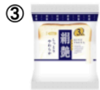
③ 絹艶 3枚入り