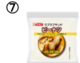
⑦ ラブラブサンド ピーナツ