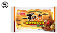
⑤ ずっしり焼きそば & マヨ