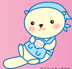
マスコットキャラクター「かいごん」