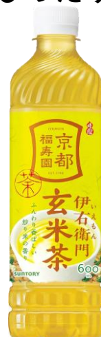
伊右衛門 玄米茶 600ml